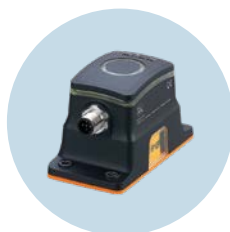
Positionssensor MVQ Überwachung und Diagnose von Schwenkantrieben