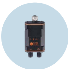
USB-IO-Link-Master Zum Parametrieren und Analysieren von Geräten