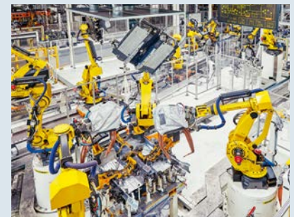
NearFi-Technologie in der Automobilindustrie