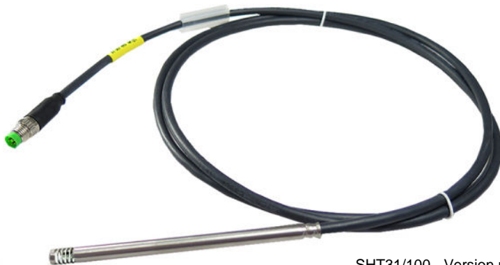
SHT31/100 - Version mit 100mm Schutzrohrlänge

Der Sensor ist bereits abgeglichen und kann somit einfach an das passende Auswertegerät angeschlossen werden.