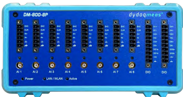
dydaqmeas mit 8 analogen Eingängen, digitalen I/O und leistungsfähigem ARM ® Prozessor

Jedes dydaqmeas Messsystem ist gleichzeitig ein leistungsfähiger Edge Computer mit integriertem Webserver. Alle Funktionen sind über die moderne Weboberfläche in einem Browser einzurichten und zu verwalten. Über individuell gestaltete Dashboards können die Messdaten überall auf der Welt in einem Webbrowser angezeigt werden.