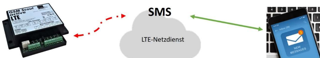
Abb. 1: Über den LTE-Netzdienst kann der Versand der SMS fehlschlagen.

Zu Schwierigkeiten bei der Nutzung von SMS als Nachrichtenmedium in der Fernwartung führt auch, dass viele SIM-Karten, die für private Anwendungen gedacht sind, für den Versand von SMS nicht mehr geeignet sind. Mit diesen Karten können problemlos SMS empfangen werden, weil diese ja z.B. auch bei Authentifizierungsprozessen eine Rolle spielen, zum Versenden von SMS sind sie jedoch nicht (mehr) vorgesehen. Dies kann dazu führen, dass für Fernwirkgeräte Freischaltung von SMS-Diensten erforderlich sind, was für Anwender und Anwenderinnen kompliziert sein kann.