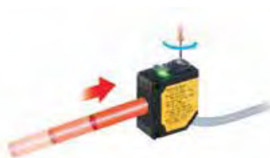
Potenziometer zur Lichtleistungsoptimierung