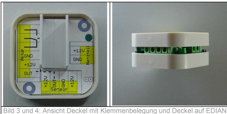
Bild 3 und 4: Ansicht Deckel mit Klemmenbelegung und Deckel auf EDIAN